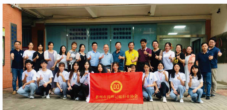
与惠州市代理记账行业协会探讨校企合作模式