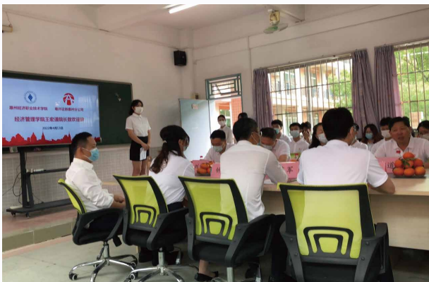
图一: 证券提升班开班仪式

(粤开证券)证券投资能力提升班不同于校内行政班,其学员来自学院大一和大二年级学生,主要以金融系学生为主,同时也面向其他专业对证券投资感兴趣的学生开放,学生以自愿加入为原则,30人为一个班级,设班长一名,企业联络人一名,兼职班主任一名,兼职班主任为金融系专任教师担任。校企双方根据学生报名人数开设相应的班级数。首届证券提升班的开设,得到了学生的热烈欢迎,广大学生证券投资爱好者积极报名,