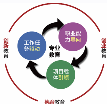
计算机网络技术专业人才培养模式示意图

(4)社会评价方面,用人单位对本专业毕业生的认可程度和评价,是学生在学习结果的最直接的反馈。结合学院的学工办,成立本专业毕业生跟踪调查小组,全面了解本专业毕业生的工作、生活情况,了解用人单位对本专业毕业生的评价反馈,及时调整人才培养策略。