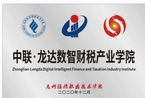
中联·龙达数智财税产业学院牌匾

中联·龙达数智财税产业学院自成立以来，着力构建“基础平台课程共享、中层方向课程分立、发展性课程融合”的产业学院课程体系。持续更新人才培养方案契合度报告，根据企业岗位工作提炼典型工作任务，确定典型职业能力，制定专业课程体系，做到课程内容与工作内容对接、专业核心课程与职业活动对接。根据科技创新和财经新岗位，实现“数智财税”专业群“基础平台课程共享、中层方向课程分立、发展性课程融合”的模块化的课程体系。