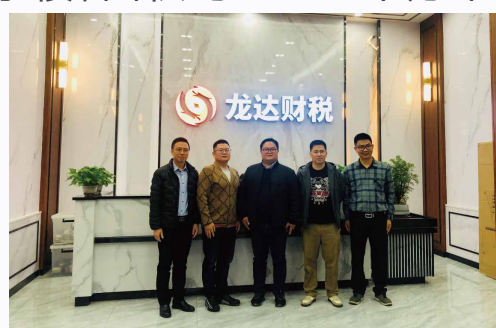
走访广东龙达财税公司

围绕国务院《职业教育改革实施方案》、教育部《职业教育提质培优行动计划(2020—2023 年)》和广东省《十四五发展规划》，2020 年底，经济管理学院先后与中联集团、金财互联子公司龙达财税科技有限公司、惠州工行、惠州代理记账行业协会等共同签订建立现代产业学院战略协议，产业学院名称为：中联·龙达数智财税产业学院，经营场所为学院第二教学楼，面积约 6000 平方米。