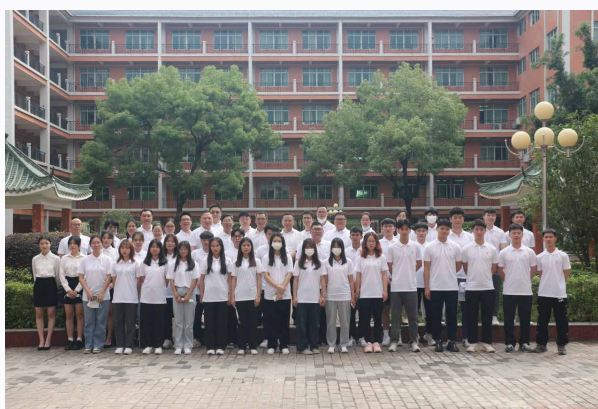
图二: 证券提升班师生合影

证券投资能力提升班可以为学校和企业提供交流和合作的平台,实现校企双向互动,通过该平台,学校能够及时了解企业最新人才需求状况,为人才培养方案的制定、师资力量强化、实训室的建设、学生实习就业以及专业建设工作提供有力支撑,从而达到为社会培养高素质技能型金融人才的目标;企业通过证券提升班的开办,可以挖掘优秀专业人才,加强企业宣传、提高企业的社会服务能力,从而为企业人才储备和社会影响力的提升打下坚实的基础。证券提升班的开办对学生、学校、企业和社会都具有积极的意义,是我校在校企合作、职业教育教学改革实践方面的一次成功探索。