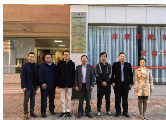
中联·龙达数智财税产业学院挂牌