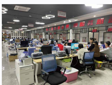
参观广东龙达财税共享中心