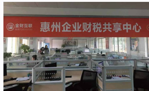
共享中心工作场景

智能财税共享服务平台是在国家金税三期、四期推广及发票电子化的大趋势下建立起来的，提供代理记账、财税咨询等服务，并采用“前店后厂”的商业模式，利用“互联网+人工智能技术”所创建的一种新型财税服务作业模式。“前