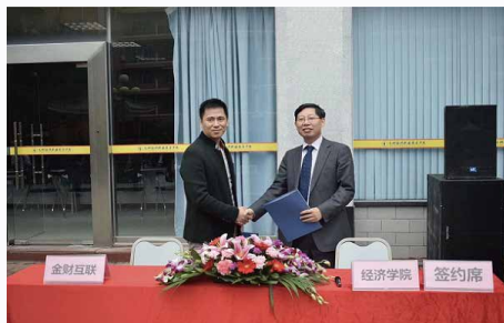
惠州企业财税共享中心签约仪式